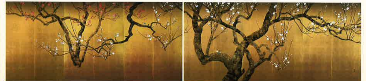
川合玉堂「紅白梅」(左隻) 玉堂美術館蔵

近代日本画壇の巨匠、川合玉堂(1873-1957)の生誕150年を記念した回顧展です。自然の中に身を置き、風景写生を重視し、そこに暮らす人々に温かいまなざしを注いだ詩情豊かな名作約40点により、日本の自然や風土に心をよせた、玉堂の芸術をあらためて紹介します。