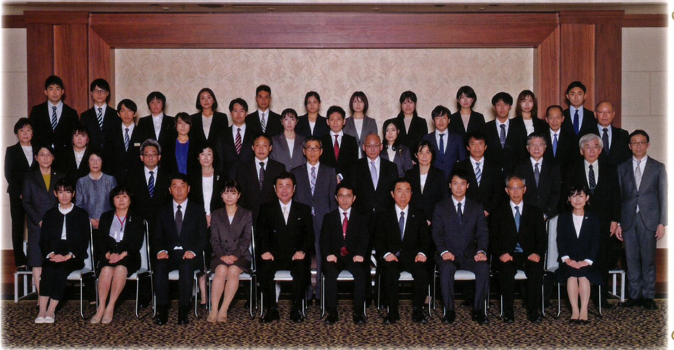
令和4年度 教育振興奨励助成贈呈式 於:高志会館